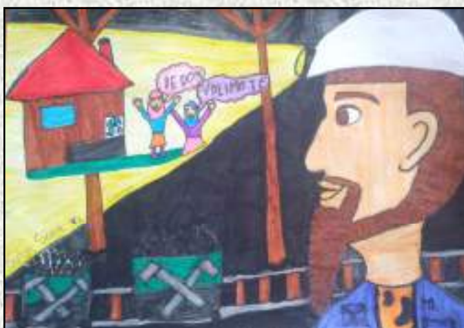
I MJESTO: SULJA SARA IVA

Povodom Dana rudara u našoj školi, imali smo mnogo izuzetno dobrih radova učenika i nimalo lak zadatak, da izaberemo najljepše među njima. Ipak, u svakom natjecanju postoje pobjednici, te smo se morali odlučiti za tri najljepša likovna i literarna rada. Učenicima su uručene nagrade, a svi ostali mogli su uživati posmatrajući likovne radove i slušajući učenike koji su imali priliku pročitati svoje literarne radove.