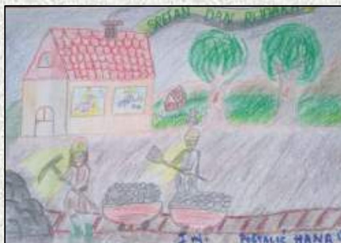
I MJESTO: PEŠTALIĆ HANA IVA