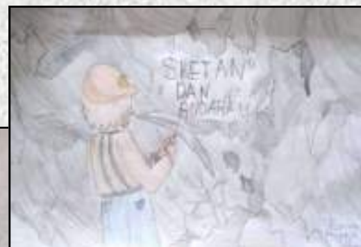
III MJESTO: MUJAGIĆ EMINA IIIC